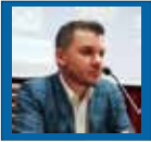
di Mauro Focci

L'ALA GIALLOBLU È DIVENTATA L'UOMO SQUADRA CHE TUTTI SI ASPETTAVANO