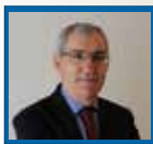
di Tranquillo Cavallo

LA ZTL DIVENTA UNA REALTA' CON QUATTRO VARCHI CONTROLLATI DA TELECAMERE INTELLIGENTI