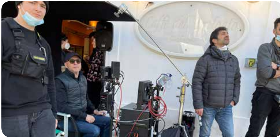
Paul Haggis vicino alla macchina da presa