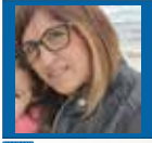
di Stefania Franciosa

NEI CENTRI ESTIVI SENZA I TIMORI DELLA VALUTAZIONE, SENZA GLI OBBLIGHI SCOLASTICI, PUR ESSENDO UN LUOGO EDUCATIVO