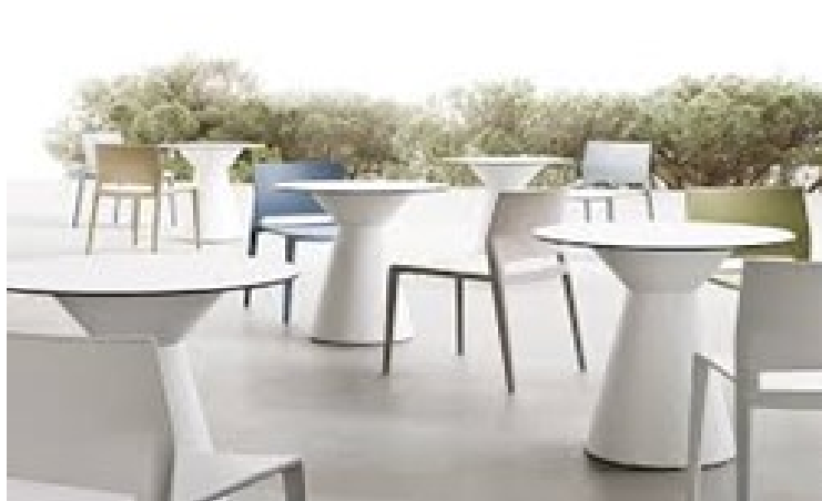
TAVOLI E SEDIE