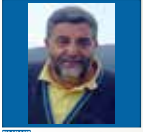
di Marcello Ignone

LA LUNA MASCIALORA ERA CONSIDERATA IL MOTORE DELLA RINASCITA E DELLA FERTILITA' DELLE COLTURE