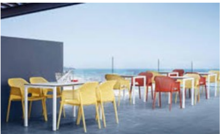
TAVOLI E SEDIE