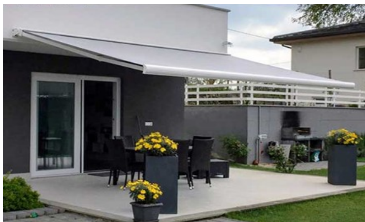
TENDE DA SOLE