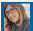
di Stefania Franciosa

NICOLA E MARIA MADDALENA SONO UNA COPPIA DI IMPRENDITORI MESAGNESI CHE STANNO PUNTANDO SUI SOCIAL