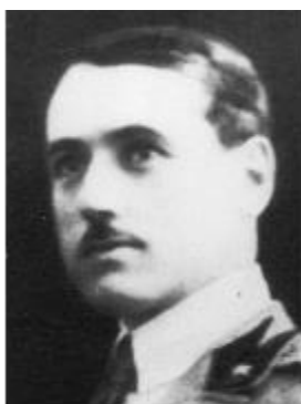
Il comandante del IX Rep. d'Assalto maggiore Giovanni Messe

Fino a questo punto il racconto dello scrittore americano.