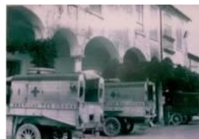
Ambulanze dell'ARC a Ca' Erizzo di Bassano