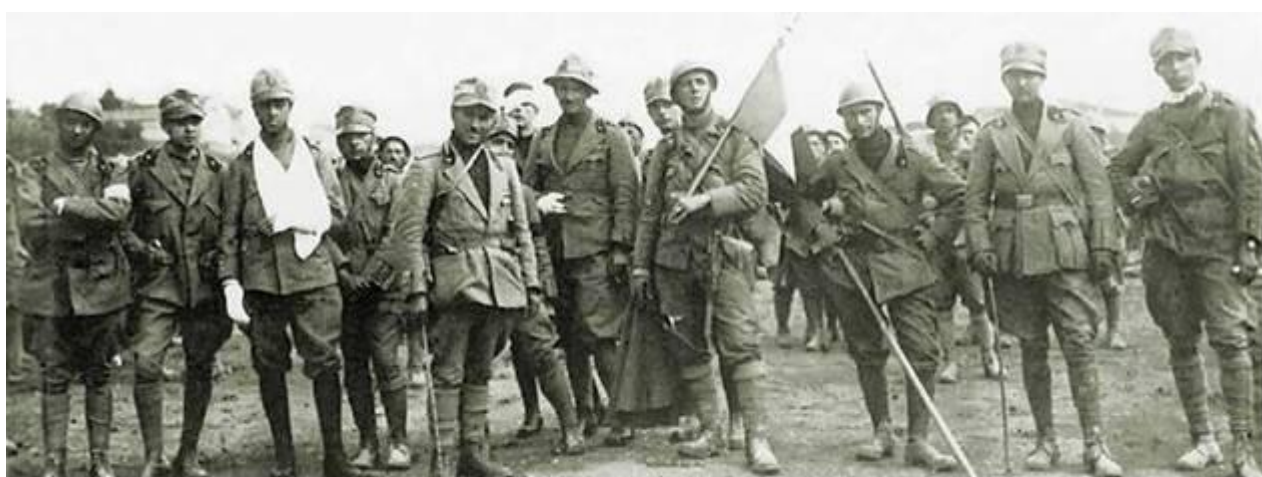
Gli ufficiali del IX arditi dopo le azioni del giugno 1918 a Pove del Grappa

In quella occasione le perdite furono le seguenti: Ufficiali, morti 5 e feriti 8; truppa, morti 30, feriti 140, dispersi 6. Né in questa testimonianza, né nella relazione ufficiale firmata dal maggiore Messe si parla di un suo ferimento.