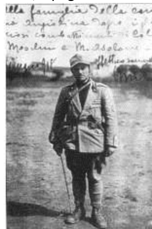
il maggiore Giovanni Messe dopo le azioni del Fenlon-Fagheron-Col Moschin

4. Siccome però il nemico premeva ed attaccava furiosamente, minacciando di tramutare l'ordinato ripiegamento in una rotta, il Maggiore Messe, presi pochi uomini, gli si lanciò contro e in un attacco furibondo lo respinse per un momento. Però ciò non sarebbe stato sufficiente se egli – messosi in una buca con me e con un'altra decina di uomini – non avesse cominciato a fare un fuoco calmo e preciso sul nemico, infliggendogli gravi perdite e costringendolo a sospendere l'inseguimento.