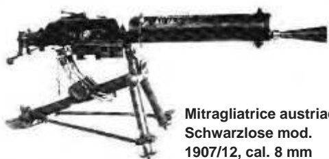
Mitragliatrice austriaca Schwarzlose mod. 1907/12, cal. 8 mm

Leggiamo un breve passaggio tratto dal suo racconto: "... Gli uomini della fila del camion stavano calandosi giù con l'ordine di schierarsi sulla strada. La strada qui era intagliata nella roccia e non c'era spazio per manovrare.