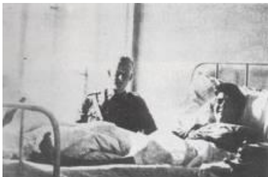
Hemingway nell'Ospedale di Milano

voluto partecipare in qualità di soldato di prima linea, ma un difetto della vista non gli permise di indossare l'uniforme di soldato americano e fu arruolato come volontario per condurre le ambulanze. In un primo tempo egli fu assegnato alla Sezione della Croce Rossa Americana con